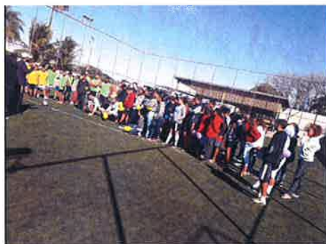
Clube da Bola.