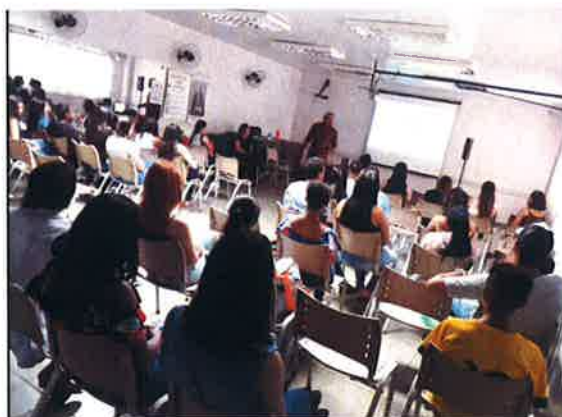
Turma do SENAC - Assistente de Recursos Humanos

Processo seletivo para o curso de Assistente de Recursos Humanos do SENAC (Público alvo: adolescentes da rede de ensino)